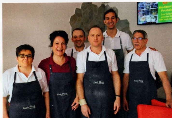
Das Team von „Tonis Pizza“ freut sich über die gelungene Erweiterung ihrer Räumlichkeiten.

DP Großhandel • Pappelallee 11 • 59557 Lippstadt www.dp-grosshandel.de