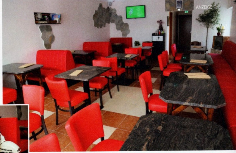
45 Gäste können ab sofort bei „Tonis Pizza“ im Lippstädter Norden ihr mediterranes Essen genießen.